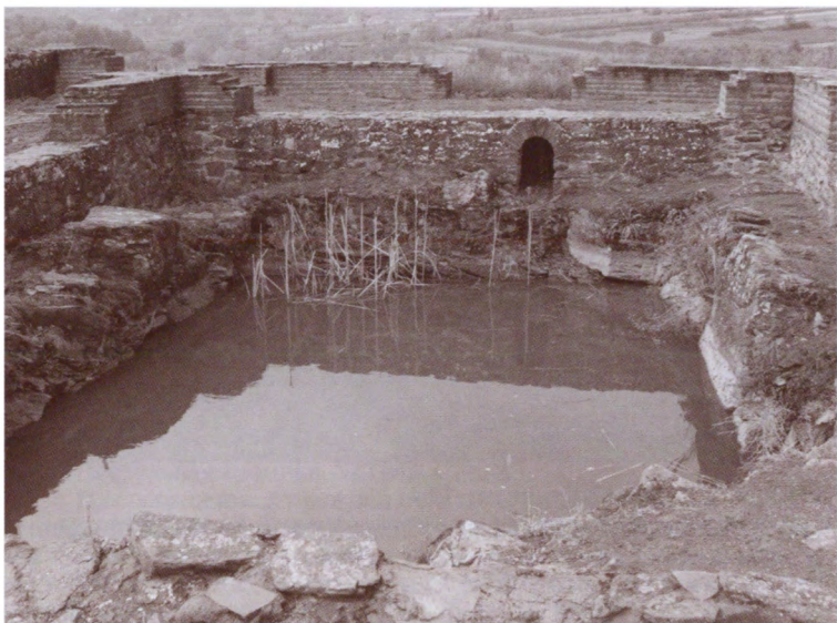
Остатки одного из сооружений Юстинианы Примы. Царичин Град, Сербия