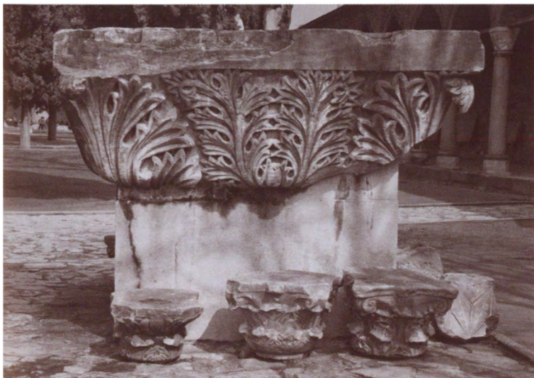
Постамент конной статуи Юстиниана с площади Августеон. Музей Топкапы. Стамбул, Турция