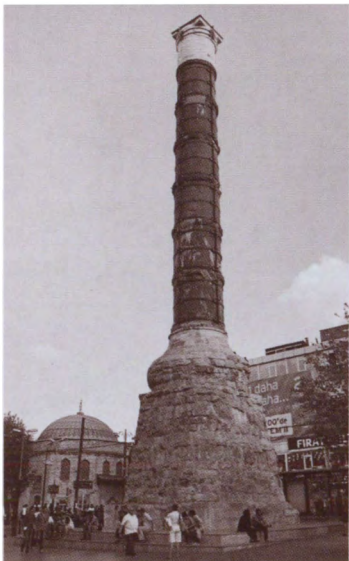
Колонна Константина I на константинопольском форуме