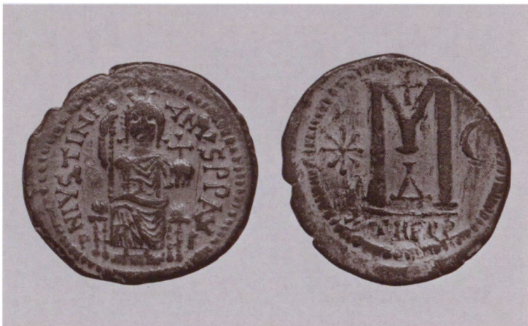
Медный фоллис, отчеканенный в 529—533 годах в Антиохии (Феуполисе)