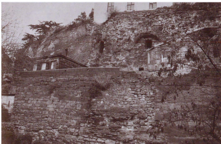
Сфендона константинопольского ипподрома