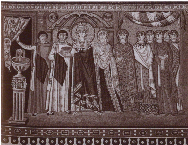
Императрица Феодора со свитой. Мозаика правой стены апсиды собора Сан-Витале