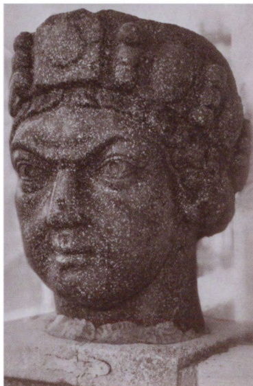
Голова императора (предположительно, Юстиниана). Собор Сан-Марко. Венеция, Италия