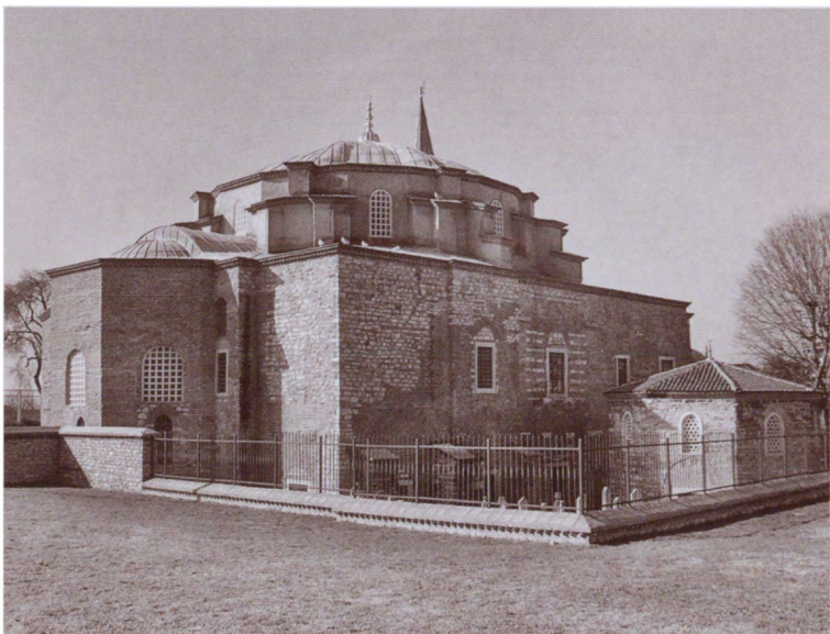
Внешний вид здания собора Святых Сергия и Вакха