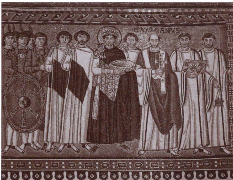
Император Юстиниан со свитой. Мозаика левой стены апсиды собора Сан-Витале