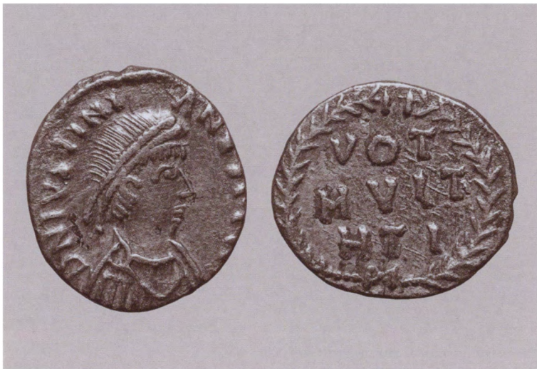
Силиква императора Юстиниана. Лицевая и оборотная стороны. Отчеканена в Карфагене