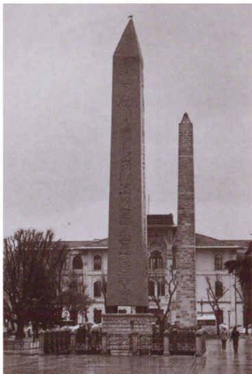
Обелиски ипподрома: на переднем плане — монолит- ный египетский, установленный при Феодосии I, на заднем — составной, сооруженный при Константине I