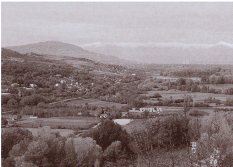
Вид с вершины холма Таора, предполагаемого места рождения Юстиниана. Окрестности Скопье, Республика Македония