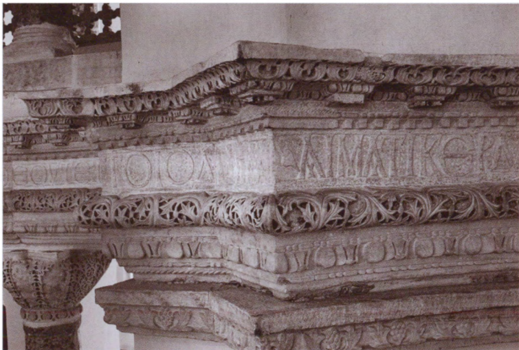
Фрагмент надписи в честь Юстиниана и Феодоры из собора Святых Сергия и Вакха. Стамбул, Турция