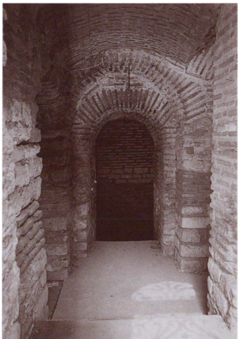
Остатки подземелий Большого императорского дворца. Стамбул, Турция