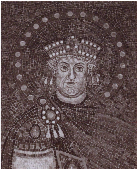
Мозаичный портрет императора Юстиниана (предположительно). Собор Сант-Аполлинаре-Нуово. Равенна, Италия