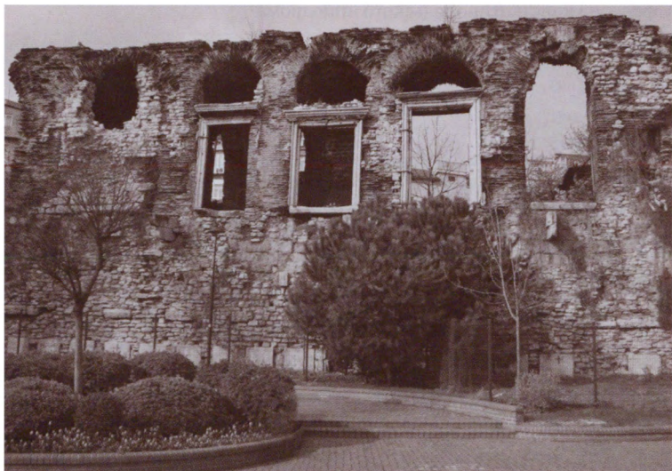
Руины императорского дворца Вуколеон. Стамбул, Турция