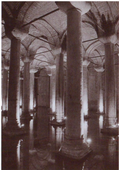
Цистерна Базилика, восстановленная Юстинианом