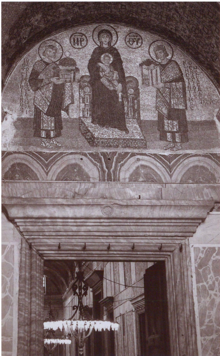
Юстиниан (слева) и Константин, предстоящие Богородице. Мозаика люнета собора Святой Софии