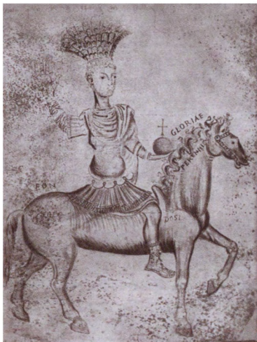
Изображение конной статуи Юстиниана на площади Августеон в Константинополе. Европейский рисунок XV в.