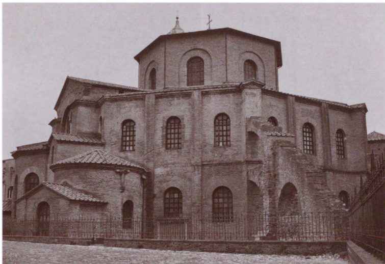
Внешний вид собора Сан-Витале. Равенна, Италия