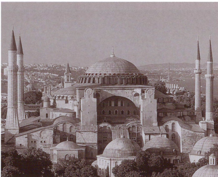
Здание собора Святой Софии. Стамбул, Турция