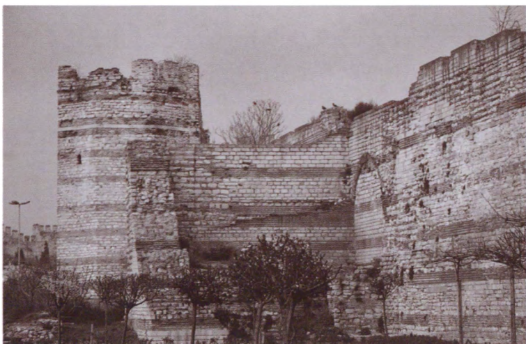
Стены и башни Феодосиевой стены Константинополя (район Золотых ворот). Стамбул, Турция