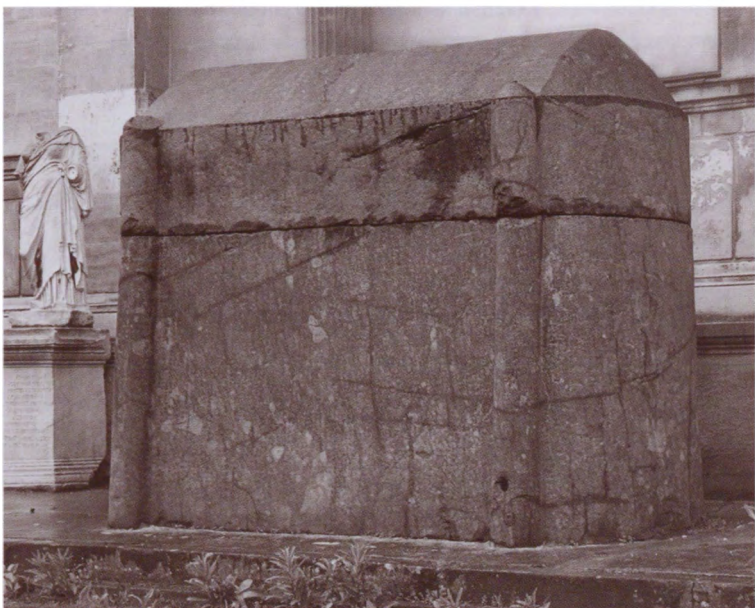
Императорский саркофаг (возможно, Константина I). Археологический музей. Стамбул, Турция