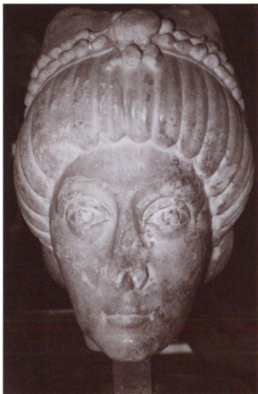
Голова императрицы (предположительно, Феодоры). Музей Сфорца. Милан, Италия