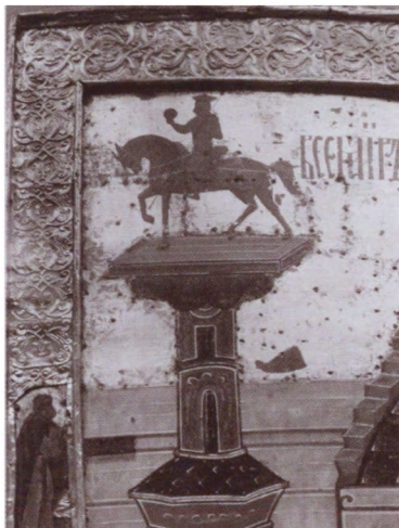
Изображение колонны с конной статуей Юстиниана на иконе «Воздвижение Креста, с избранными святыми». Вторая половина XVI в. Третьяковская галерея, Москва