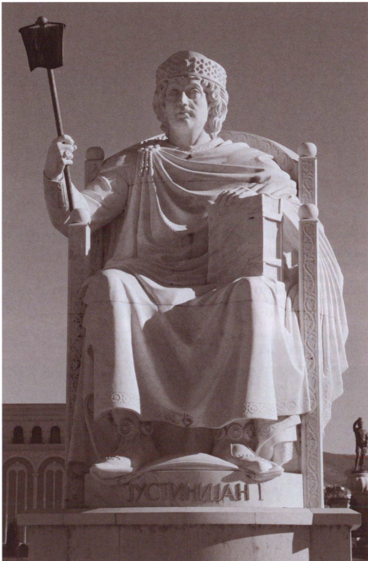
Современный памятник Юстиниану в городе Скопье, Республика Македония