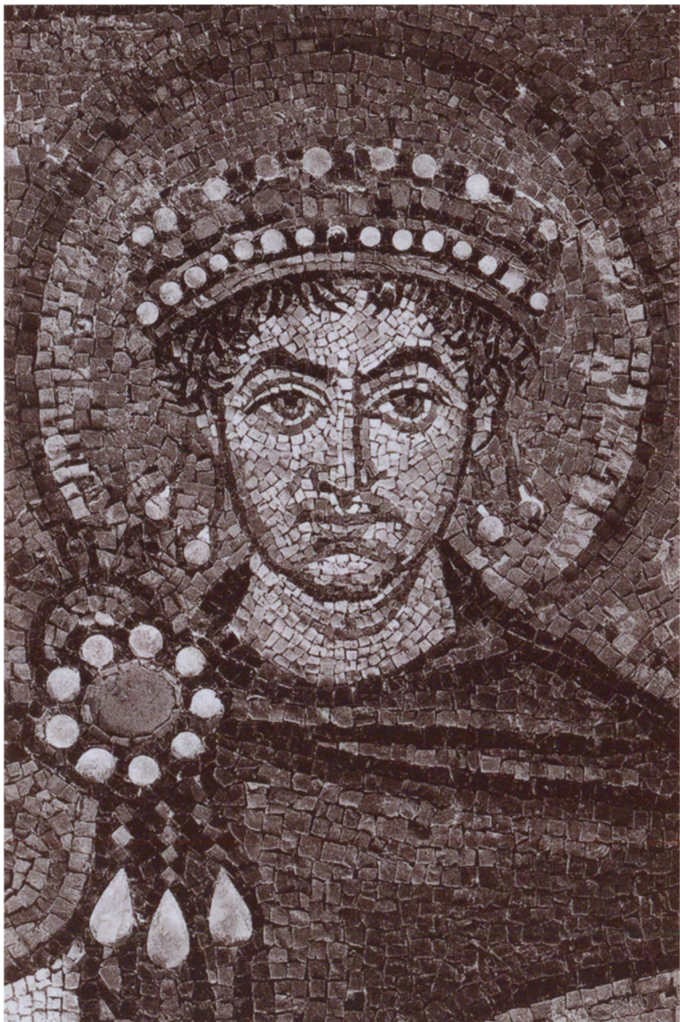
Мозаичный портрет Юстиниана. VI в. Мозаика стены апсиды собора Сан-Витале (деталь). Равенна, Италия