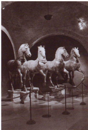
Квадрига с константинопольского ипподрома. Собор Сан-Марко. Венеция, Италия